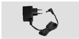
Adaptador de alimentación