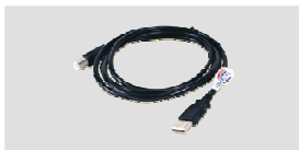
USB 2.0 線