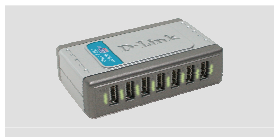
DUB-H7 Hub USB de alta velocidad con 7 puertos

Si falta alguno de estos componentes, contacte con su proveedor.